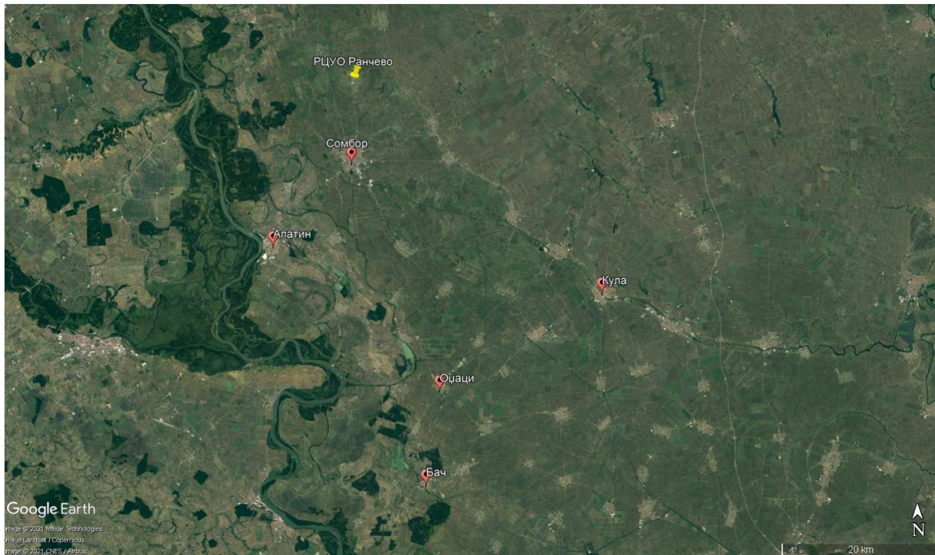
Слика 1 Преглед локација РЦУО на територији Сомбора