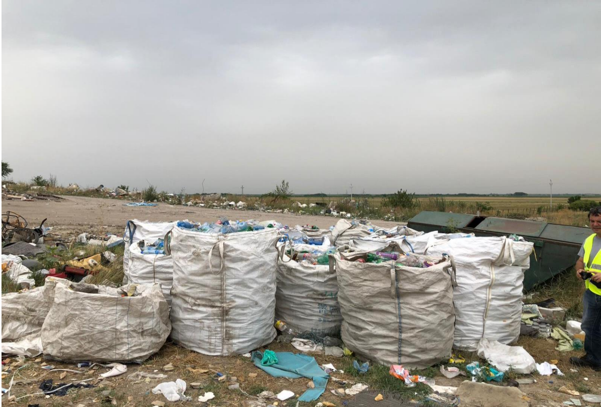
Слика 2 Локација постојеће несанитарне депоније Ранчево

РЦУО Ранчево је у надлежности града Сомбора. РЦУО Ранчево ће се састојати од санитарне депоније, МБТ-а и постројења за сортирање пластичне амбалаже.