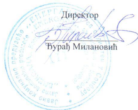
Директор Бурађ Милановић