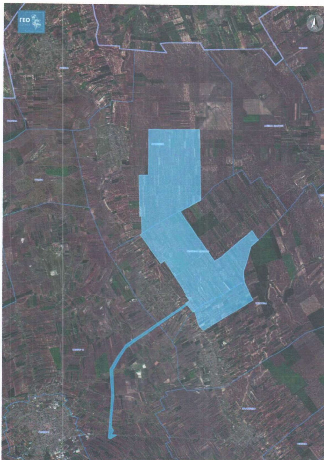
Prilog 1: Prikaz orijentacionog obuhvata na ortofoto snimku