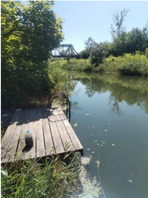
Most Staparski put